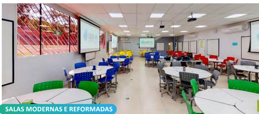
SALAS MODERNAS E REFORMADAS